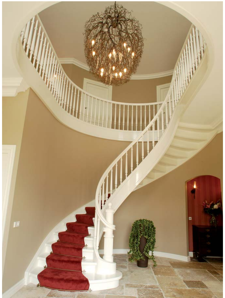
Smits Exclusieve Trappen