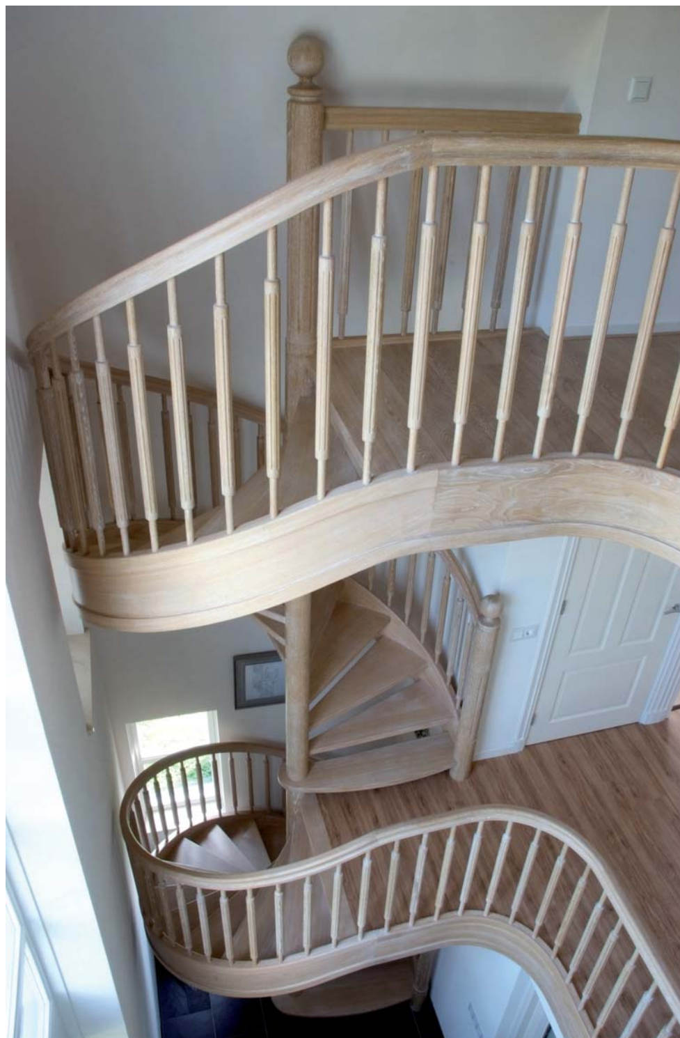
Smits Exclusieve Trappen

Elk trap brengt een eigen sfeer in een huis. Om de inrichting van uw huis te verfraaien moeten de trap qua stijl natuurlijk wel aansluiten bij het type woning. Zo geven klassieke trappen een warme en nostalgische sfeer en is een moderne trap in combinatie met roestvrij staal of glas kenmerkend voor de architectuur van eigentijdse moderne huizen. Veel trappen zijn een voorbeeld van design en zijn vernieuwend van vorm en materiaal. Ook 'minimalistische' trappen mogen we onder design rekenen, zoals een bijzondere trap die slechts één vierkante meter vloeroppervlak nodig heeft. Vooral in stedelijke gebieden, waar men veelal te kampen heeft met een groot ruimtegebrek, is deze trap een goed voorbeeld van hoe een functioneel probleem tot een artistieke oplossing kan leiden.