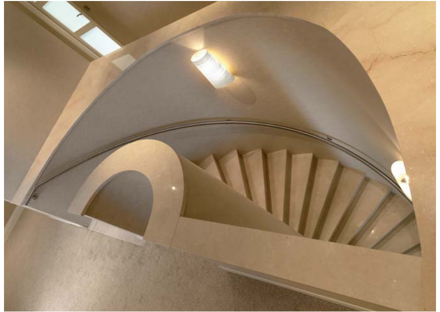
Thijs & Van der Voort natuursteenwerken