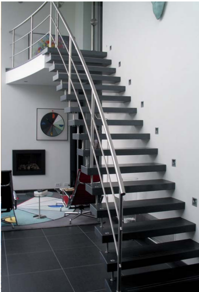
Snep Exclusieve Metalen